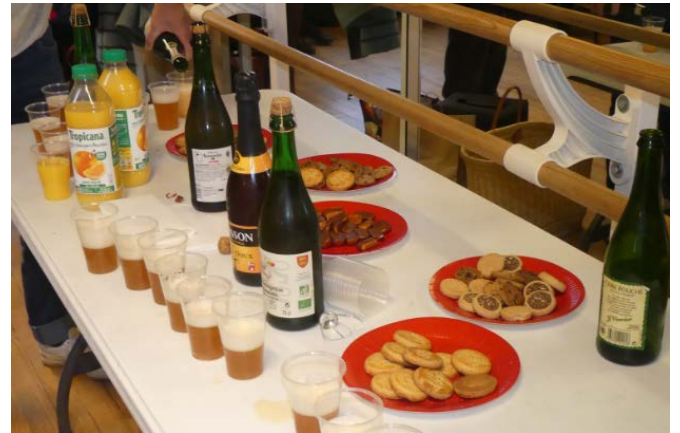
L'heure du goûter