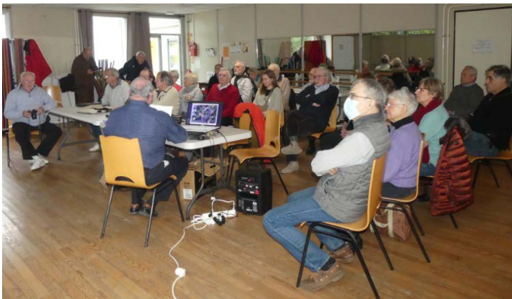
Quand le maître de conférence parle, les élèves écoutent