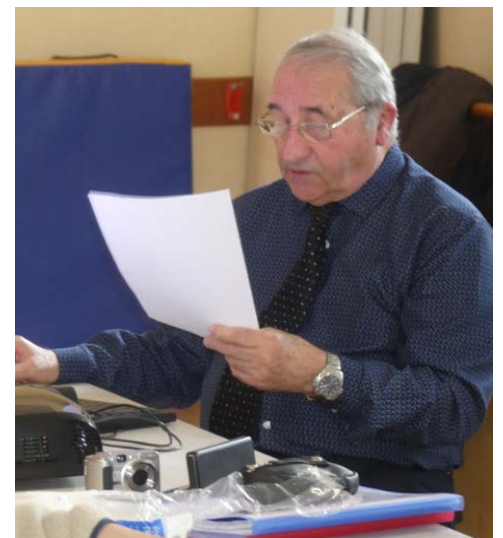
Sherlock en pleine révision