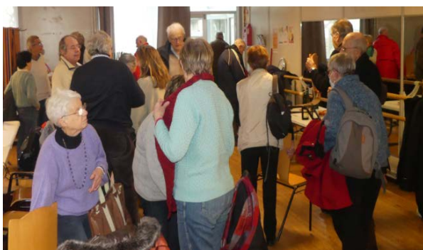
L'heure de la récré à sonné