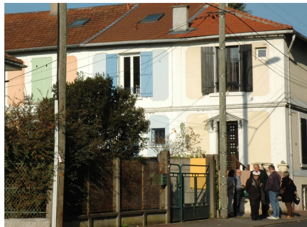
Pierre GILLON accueille les invités à l'entrée de la villa Nicole GIRARD-MANGIN